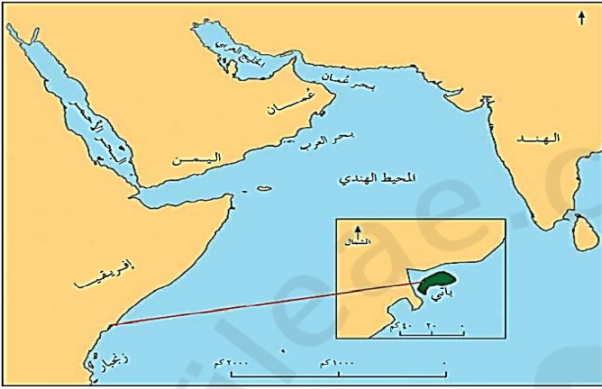
الشكل (٣) موقع جزيرة باتني

١ - الجزيرة المضللة بالخريطة التي أمامك تتبع دولة: