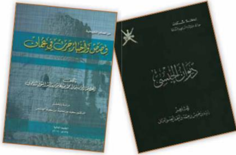
الشكل (١٦) من النتاج الثقافي في عصر اليعاربة