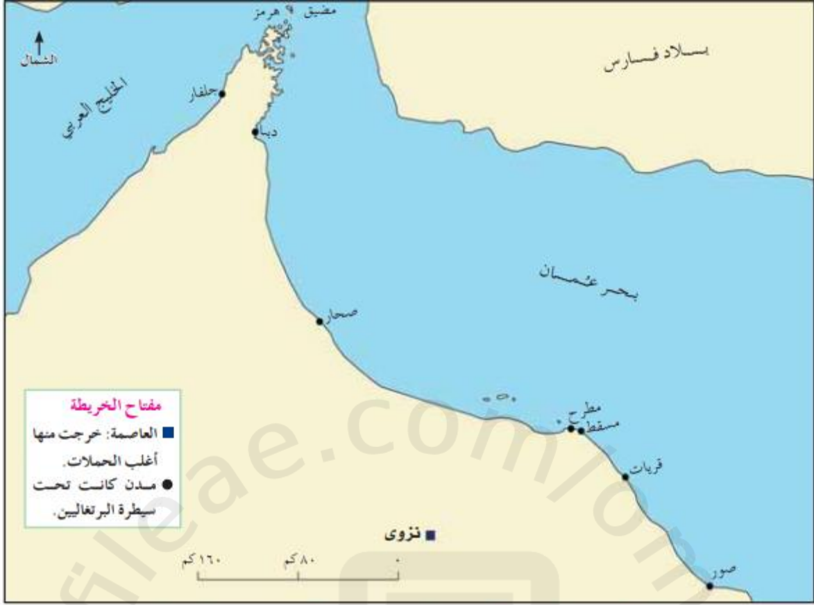
(الشكل ١٠) المدن العُمانية التي حرَّرها العُمانيون من البرتغاليين

التعامل مع الخريطة بالاستعانة بالخريطة في الشكل (١٠) ومصادر التعلم المختلفة، تتبَّع ومجموعتك مسار الحملات العُمانية ضد البرتغاليين على طول الساحل العُماني، ثم صمم خريطة ذهنية موضِّحًا مسار الحملة وقائدها، واعرض عملك في الصف.