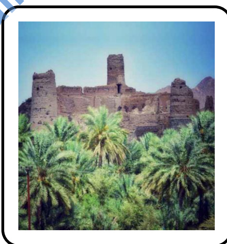
حصن الأسود في مقتنيات بولاية عبرى