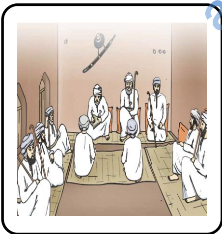
محكمة في العصر النباهني