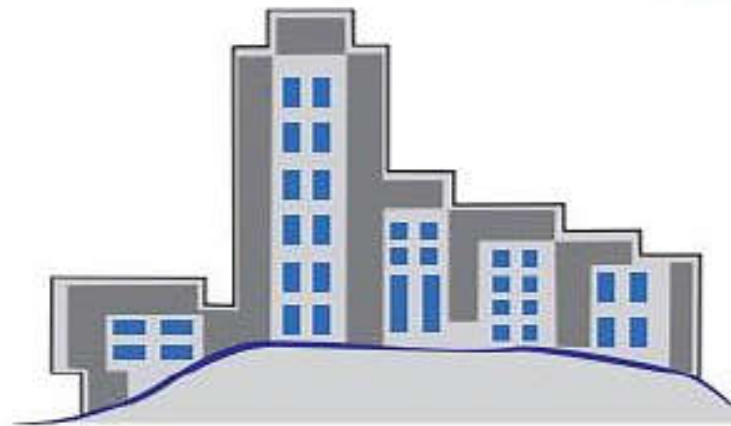
الجهات والمؤسسات والشركات (الطلب)

يُعرف على أنه سوق افتراضي (نظري)، يتضمن القوى العاملة والعارضين لفرص العمل من المؤسسات الحكومية والخاصة.