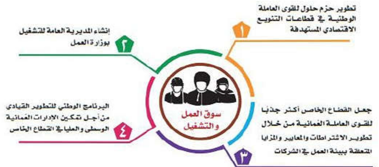
الشكل (٥) من الإجراءات والمبادرات لتطوير سوق العمل العُماني

س١٩/ عدد اهم الاجراءات التي اتخذتها السلطنة لمواجهة التغيرات التي طرأت على المنظومة الاقتصادية في سوق العمل؟ ج١٩/ تحسين القوانين و السياسات و الانظمة، تنميه و تدريب الموارد البشرية ، تقليل الفجوه بين السياسات و الانظمة و متطلبات سوق العمل.