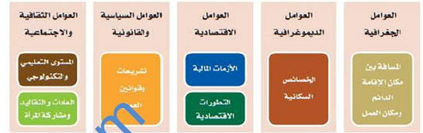
الشكل (٢) العوامل المؤثرة في سوق العمل

وبتأثر سوق العمل العالمي بمجموعة من العوامل يوضحها الشكل (٢).