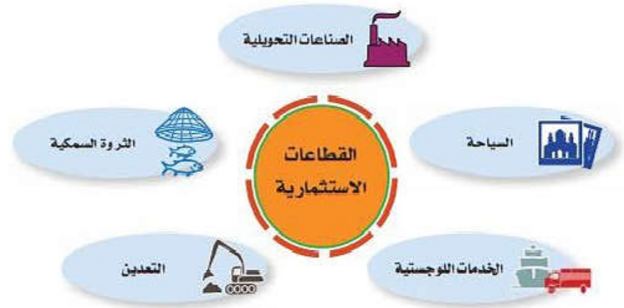
الشكل (٣) القطاعات الاستثمارية في سوق العمل العماني

تنوع القطاعات الاقتصادية في سلطنة عُمان، والتي من المأمول أن تسهم في الناتج المحلي الإجمالي وتساعد على تنويع مصادر الدخل، وتركز الجهات المُعنيَّة في السلطنة في الوقت الراهن على عدة قطاعات اقتصادية واعدة يوضِّحها الشكل (٣).