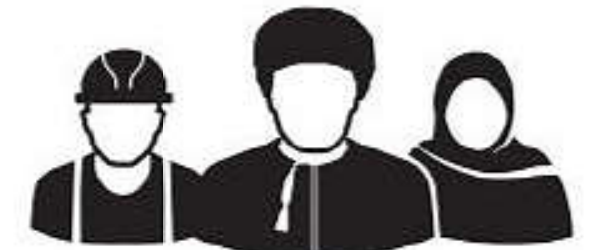
القوى العاملة (العرض)