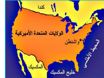
الولايات المتحدة الامريكية