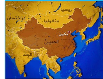
جمهورية الصين الشعبية