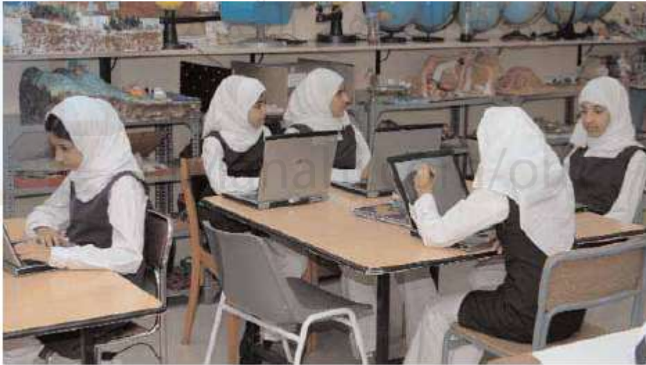
استخدام التقنيات في التعليم

✓ تم ادخال الطرق والأساليب الحديثة في التعلم باستخدام تقنيات المعاصرة كالحاسوب وأجهزة العرض والوسائل الحديثة.