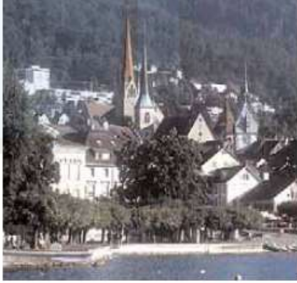
أنماط البناء ... ثقافة عالمية