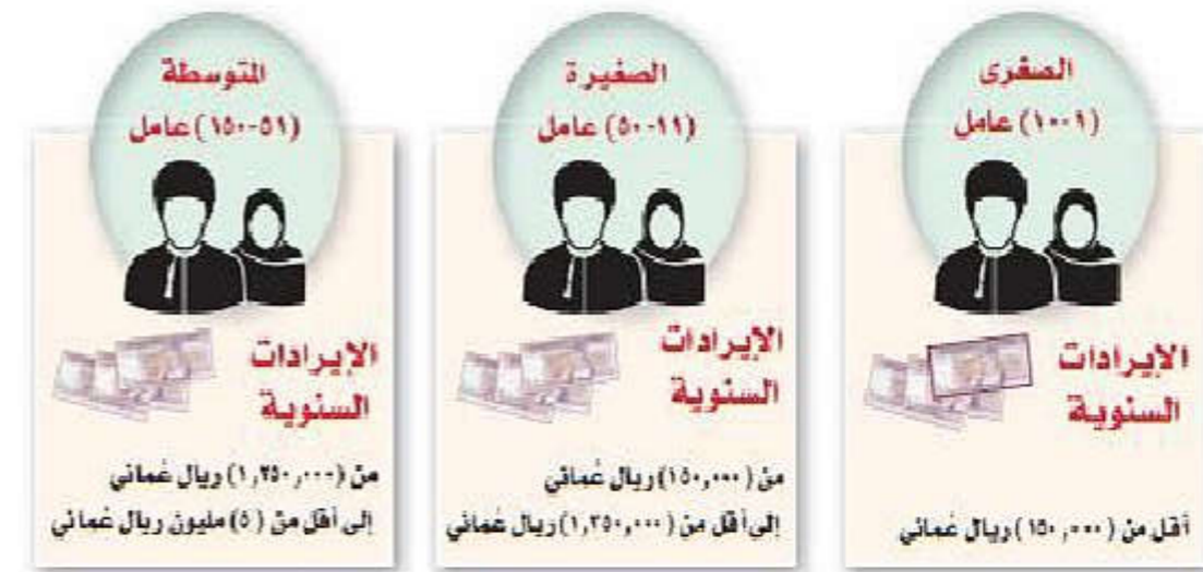
الشكل (٧) معايير تصنيف المؤسسات الصغيرة والمتوسطة في سلطنة عُمان

تعدد المعايير المعتمدة لتصنيف المؤسسات الصغيرة والمتوسطة من دولة لأخرى، ويُعد معيار أعداد العاملين وحجم المبيعات في المؤسسة من أكثر معايير التصنيف شيوعاً، واعتمدت سلطنة عُمان هيئة في هيئة تنمية المؤسسات الصغيرة والمتوسطة هذا المعيار لتصنيف المؤسسات في سلطنة عُمان تماشياً مع الوضع الاقتصادي في البلاد (الشكل ٧).