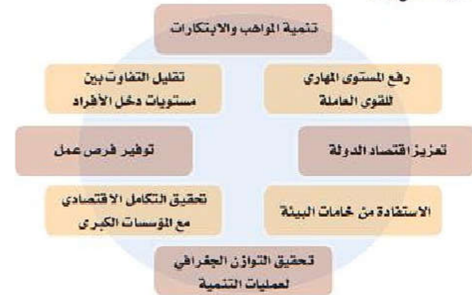
الشكل (٦) من فوائد المؤسسات الصغيرة والمتوسطة

للمؤسسات الصغيرة والمتوسطة أهمية كبيرة؛ نظرًا لما تتميز به من مرونة وقدرة على التأقلم في محيط اقتصادي تنافسي، ونتيجة لذلك أصبحت الركيزة الأساسية للاقتصاد العالمي، ففي عام ٢٠١٧ م بلغت نسبة مساهمة تلك المؤسسات في الناتج المحلي الإجمالي للولايات المتحدة الأمريكية حوالي (٥٠٪) في حين وصلت النسبة لحوالي (٦٠٪) في الصين، وللمؤسسات الصغيرة والمتوسطة العديد من الفوائد يوضحها الشكل (٦).