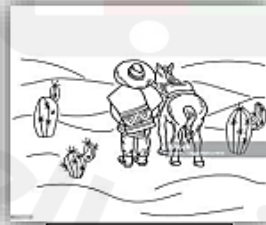
بيئة رقم (١)