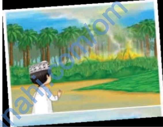
انظر في ملكوت الله ترى قدرته