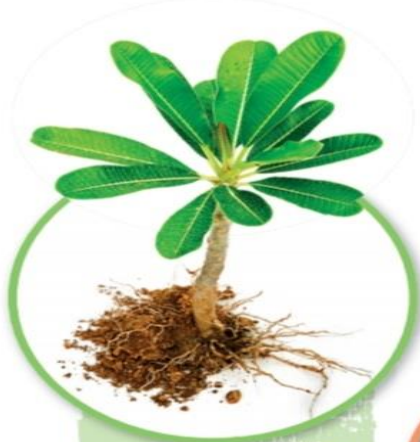
نبات ذو جذور سليمة

النَّبَاتُ السَّلِيمَةُ لها جُذُورٌ وَسِيقَانٌ وَأُورَاقٌ سَلِيمَةٌ.