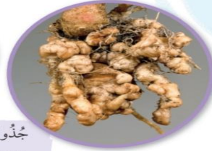
جذور غير سليمة مُصابة بمرض عقدة الجذر