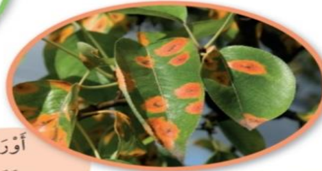
أوراق غير سليمة مُصابة بمرض الصدأ

لَا يَنْمُو النَّبَاتُ ذُو الْجُذُورِ وَالسِّيقَانِ وَالأُورَاقِ غَيْرِ السَّلِيمَةِ جَيِّدًا.