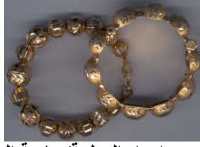
إعداد المعلمة/ مارية الهنائي