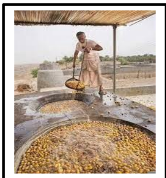
موسم تبسيل التمور