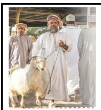
فن المناداة في البيع والشراء