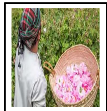
موسم حصاد الورد