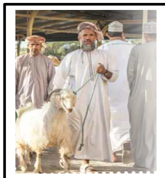
فن المناداة في البيع والشراء