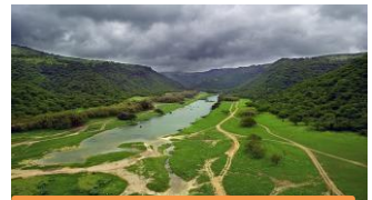
شلالات وادي الدريبات