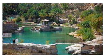
وادي بني خالد