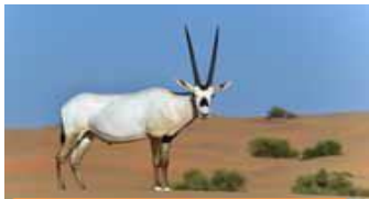
محمية المها العربي