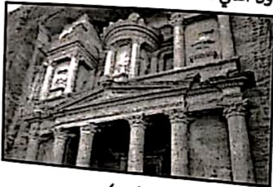
الصورة ( ب )

٢- قارن بين الصورة رقم ( أ ) والصورة رقم ( ب ) حسب الجدول التالي :