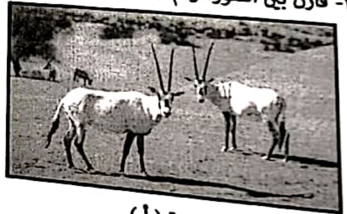
الصورة ( أ )