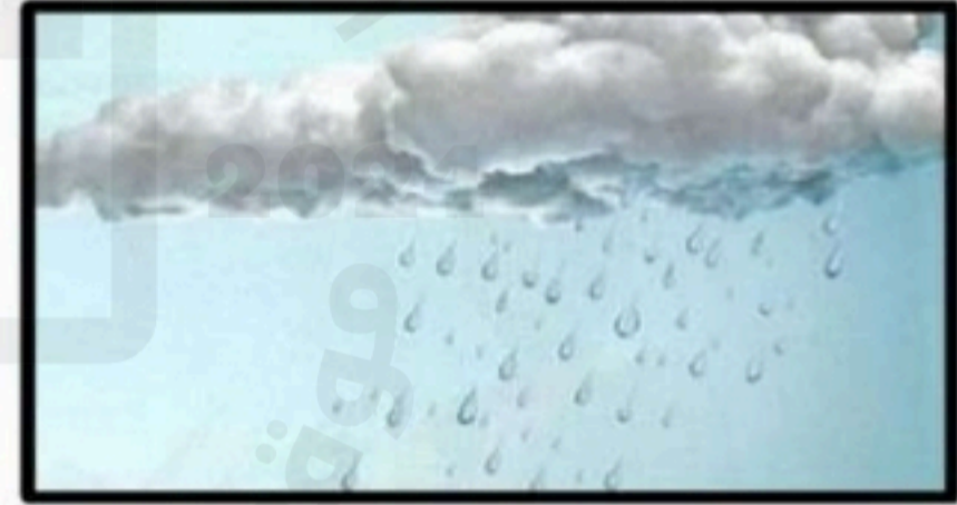
الصورة (٣): ماء (.....)

٢- (توضاً سامي لأداء صلاة الظهر بماء البحر). يعتبر وضوءه هذا :