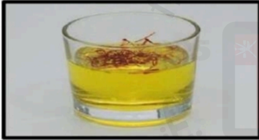
الصورة (٤): ماء (.....)