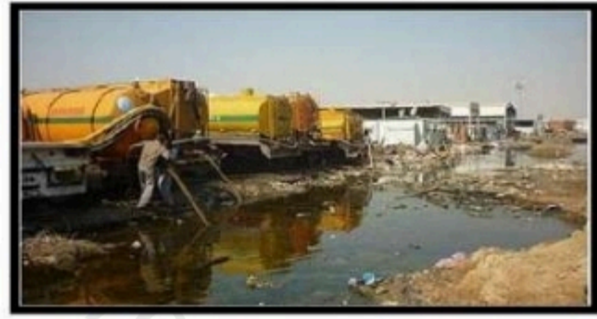
الصورة (١): ماء (.....)