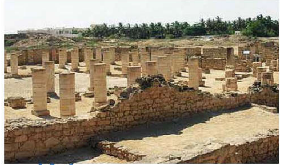
آثار من مدينة البليد بظفار