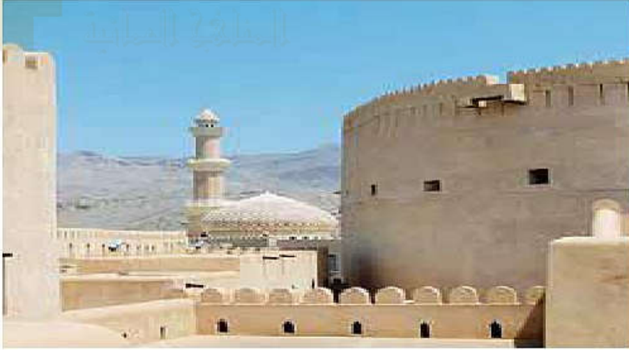
جامع نزوى أو ما يسمى حاليا بجامع القلعة