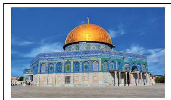
مسجد قبة الصخرة في فلسطين