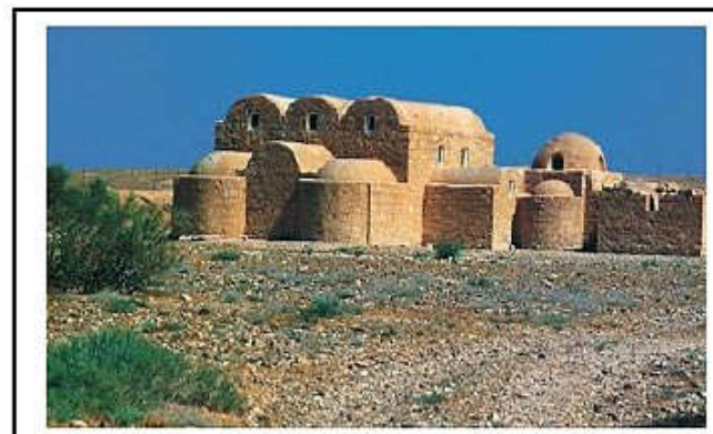
قصر غمره في الأردن