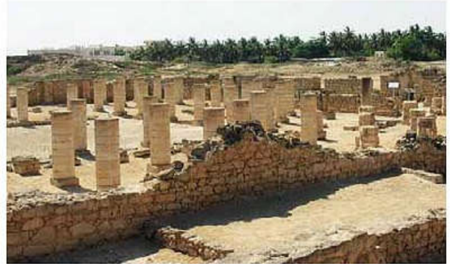
آثار من مدينة البليد بظفار