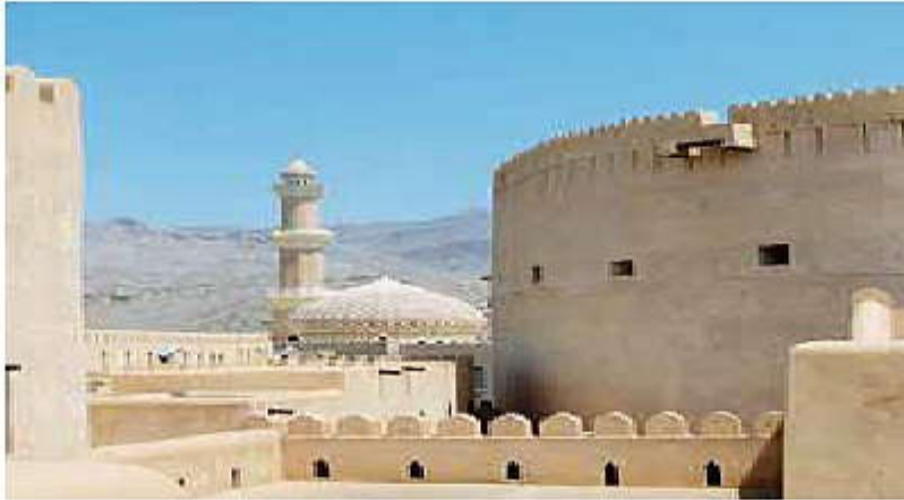
جامع نزوى أو ما يسمى حاليا بجامع الفتحة