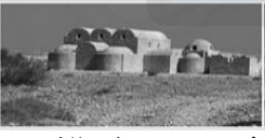
قصر عمرة في الاردن