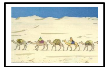
احدى القوافل التجارية