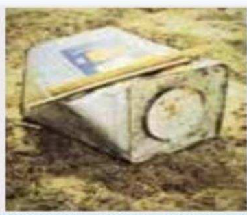
آلة التَّنَك (الباتو)