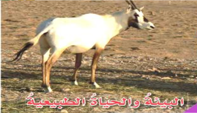
البيئة والحياة الطبيعية