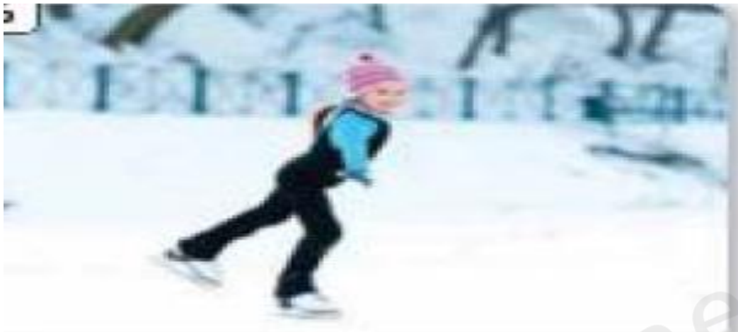
go ice skating