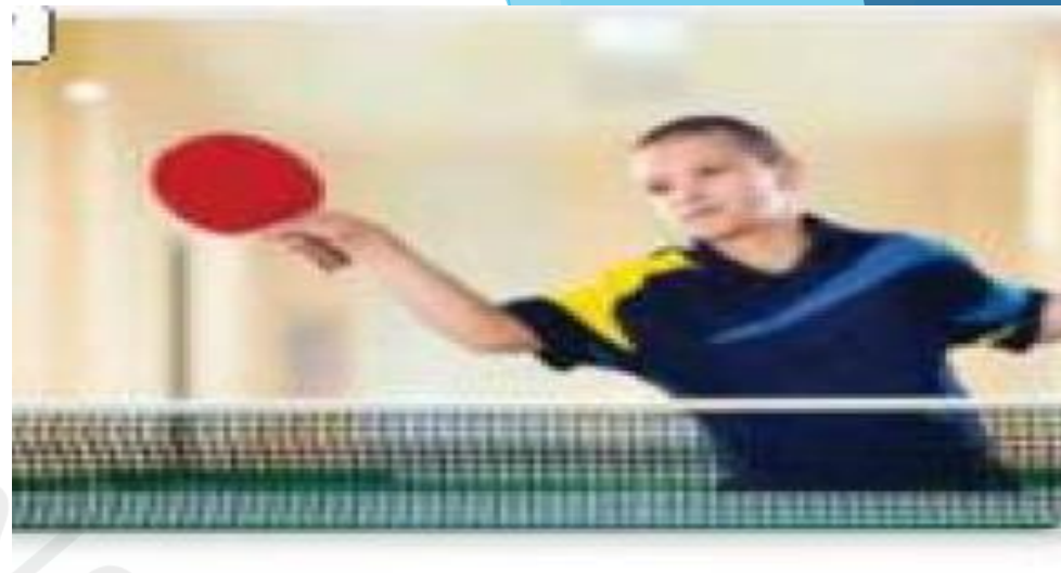
play table tennis