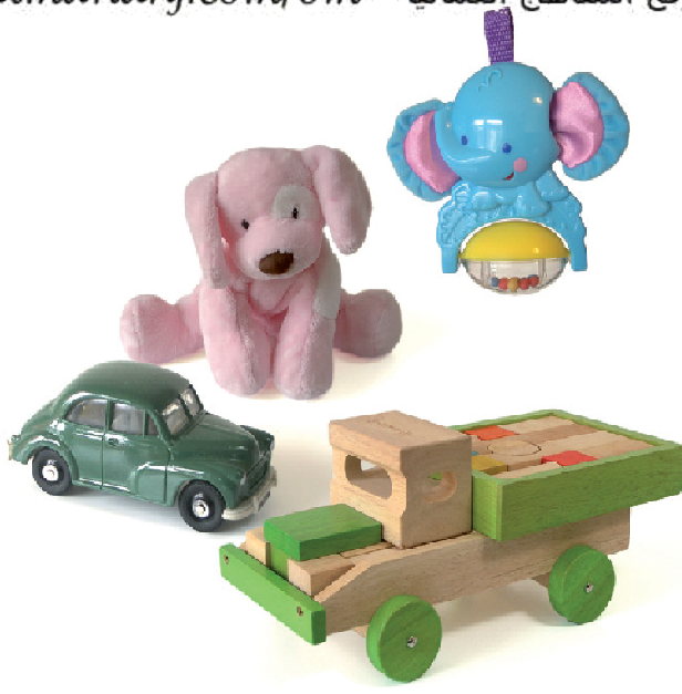
ألعاب مصنوعة من موادّ مختلفة