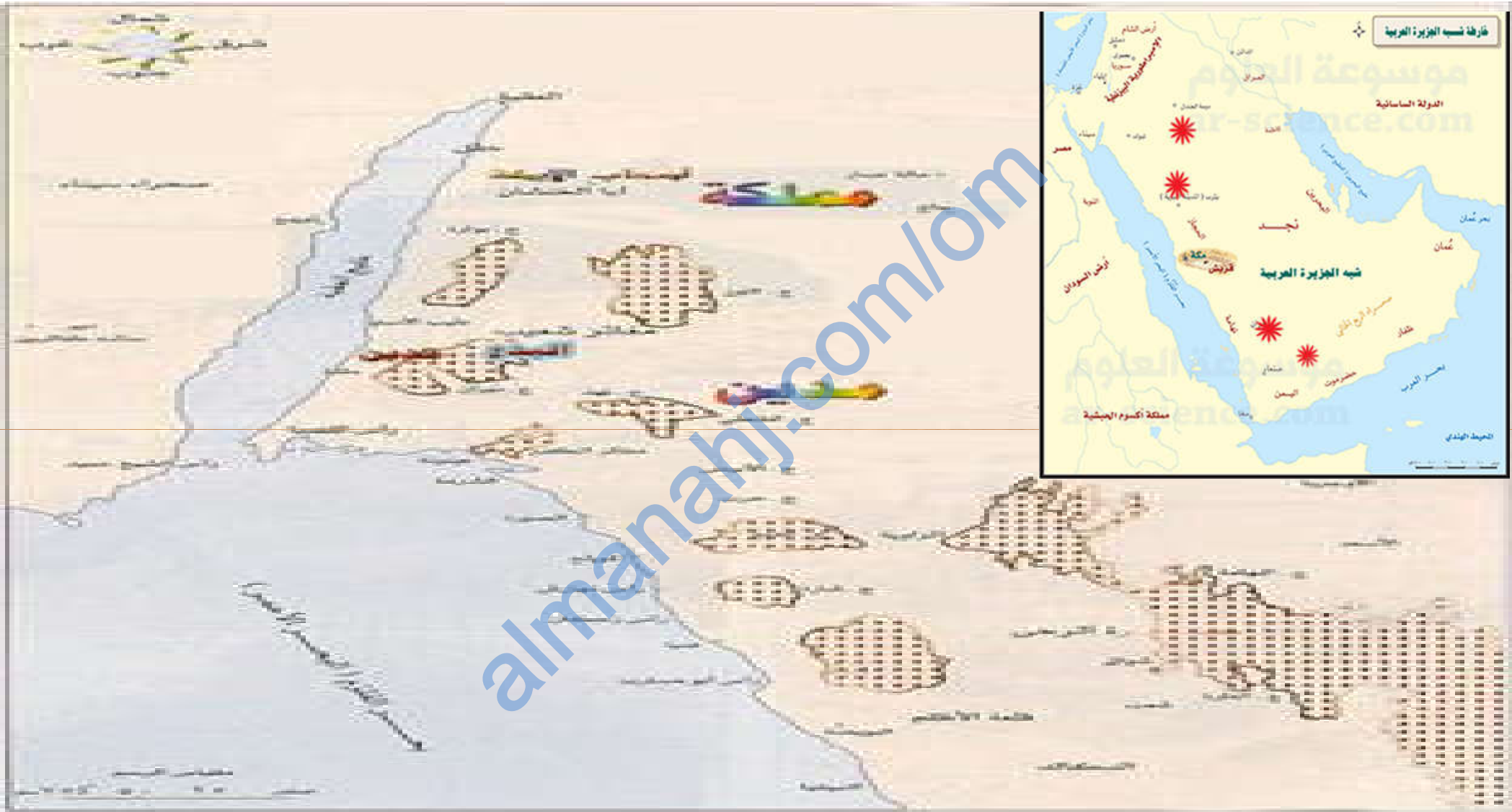
مملكة أكسوم الحبشية