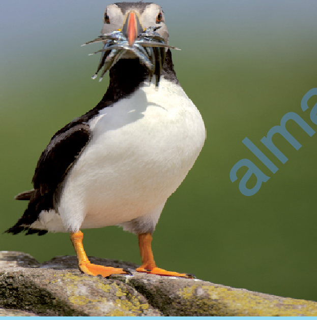
طائر البفن (المهرج الوفي)

ومثال على ذلك هو ما حدث عندما تقلّصت أعداد طائر البفن (المهرج الوفي) في بعض الأنحاء بإسكتلندا، حيث يتغذى هذا الطائر على نوع من الأسماك يُسمى الإنقليس، فعندما يصطاد الناس كثيراً من هذه الأسماك قد لا يجد طائر البفن ما يكفيه من الغذاء.