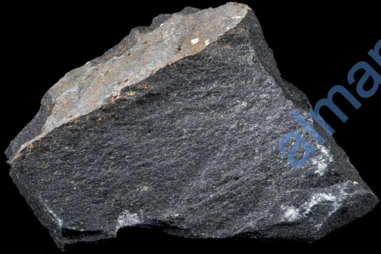
تتشكّل صخورُ البازلت Basalt عندما تبرد الحمم البركانية الذائبة بالقرب من سطح الأرض.

الطريقة التي تبردُ بها الحمم البركانية الذائبة تؤثر أيضًا على نوع الصخور التي تكوّنُها، فعندما تبرد الحمم البركانية الذائبة تحت الأرض في الأعماق، فإنها تبرد ببطءٍ شديدٍ؛ وهذا لأنها محاطةٌ بصخور ساخنة وتمنح عملية التبريد البطيئة الكثير من الوقت لكي تتشكّل بلورات Crystals كبيرة الحجم.