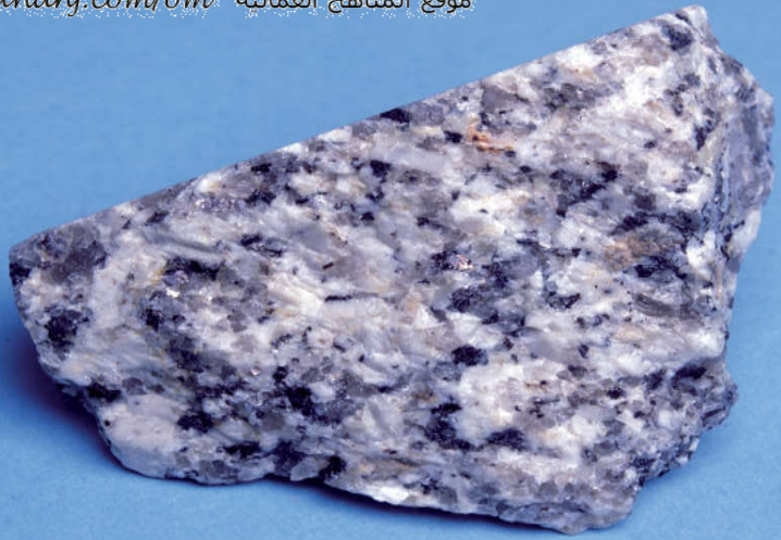
تتشكّل صخورُ الجرانيت Granite عندما تبرد الحمم البركانية الذائبة في أعماق الأرض.