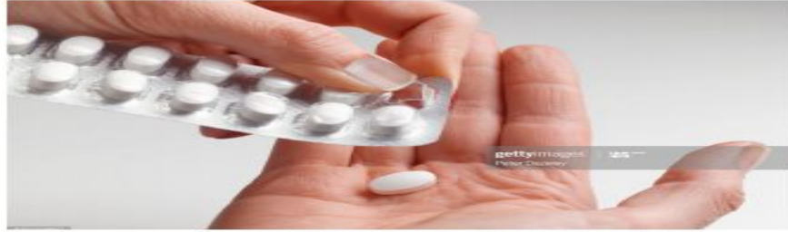
الصورة ٦-٢ أقراص للتخفيف من عسر الهضم تحتوي على هيدروكسيد الماغنيسيوم

هيدروكسيد الماغنيسيوم مادة شائعة تُستخدم للتخفيف من عسر الهضم الناتج من زيادة الحموضة في معدتك.