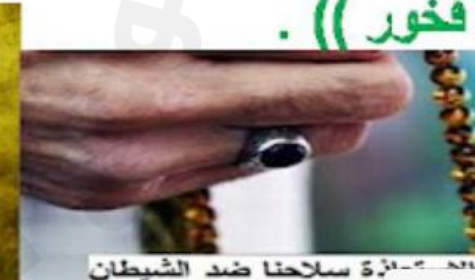
أداة سلاحنا ضد الشيطان