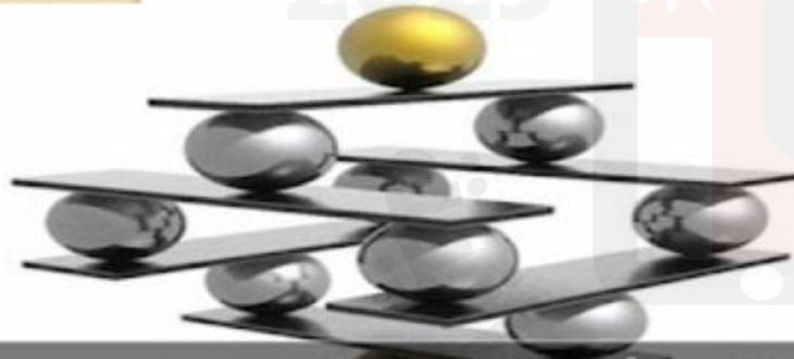
الوسطية من أبرز خصائص الإسلام