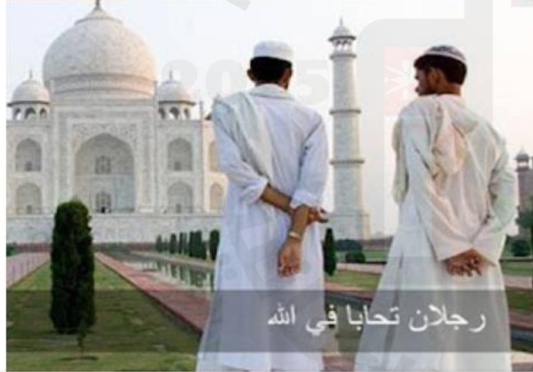
رجلان تحابا في الله

قال رسول الله صلى الله عليه وسلم : إِنَّ اللَّهَ يَقُولُ يَوْمَ الْقِيَامَةِ أَيْنَ الْمُتَحَابُّونَ بِجَلَالِي الْيَوْمِ أَظْلَهُمْ فِي ظِلِّي يَوْمَ لَا ظِلَّ إِلَّا ظِلِّي