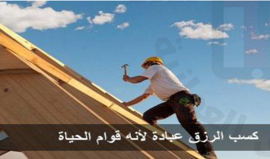
كسب الرزق عبادة لأنه قوام الحياة

1- الحث على الكسب المشروع قال تعالى : (( هو الذي جعل لكم الأرض ذلولا فامشوا في مناكبها وكلوا من رزقه وإليه النشور )) و اجتناب الكسب الحرام وتنمية المال بكل الوسائل المشروعة كالزراعة والتجارة.