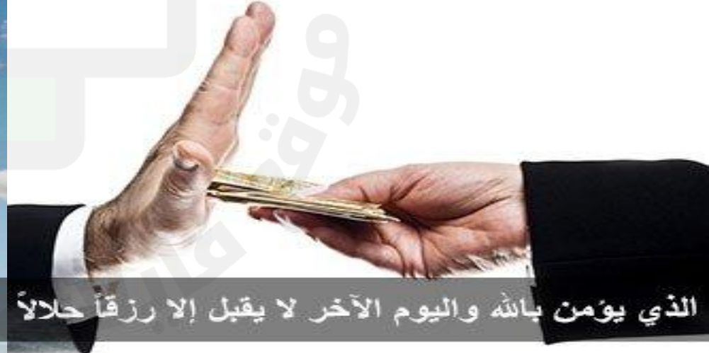
الذي يؤمن بالله واليوم الآخر لا يقبل إلا رزقاً حلالاً