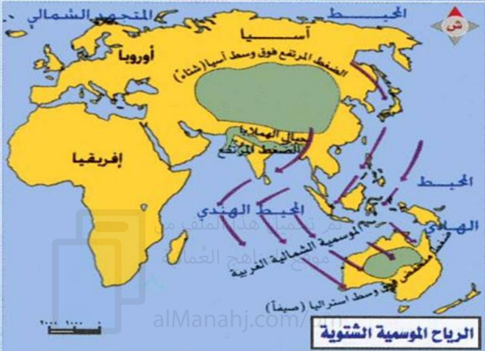
الرياح الموسمية الشتوية