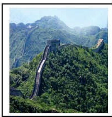
سور الصين العظيم