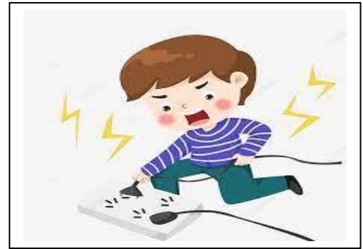
أَحْذَرُ خَطَرَ الكَهْرَبَاءِ