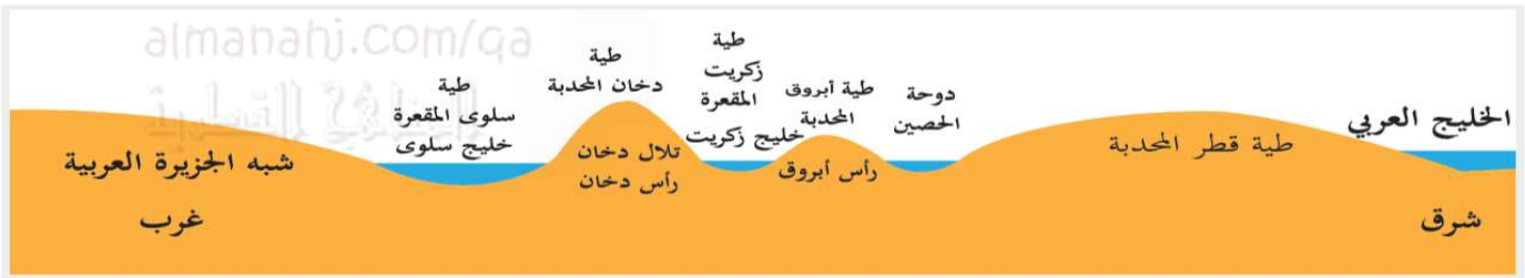
شكل (5) مقطع عرضي للتراكيب الجيولوجية لدولة قطر

ويمكنك عزيزي الطالب أن تتعرف أهم التراكيب الجيولوجية لدولة قطر من خلال الشكل (5) الذي أمامك.