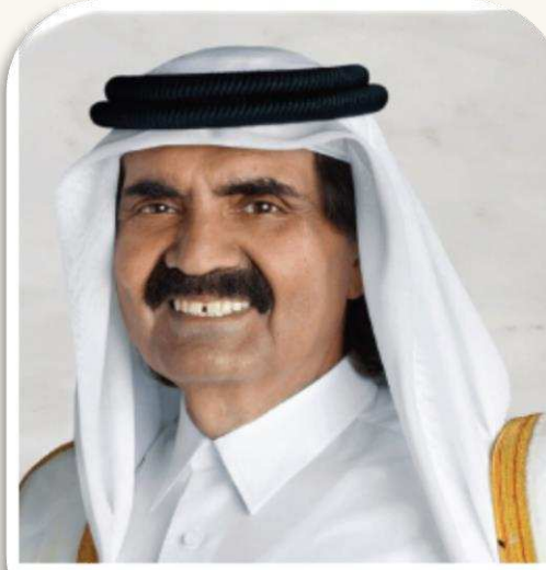
سمو الشيخ حمد بن خليفة آل ثاني