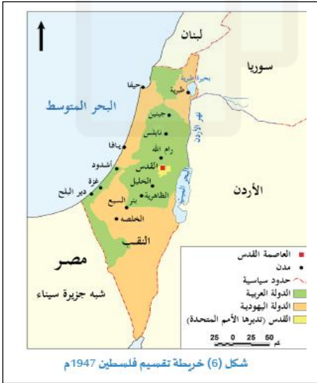
شكل (6) خريطة تقسيم فلسطين 1947م