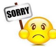
( apologize – import )