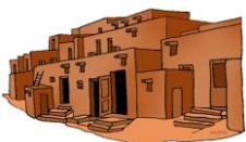
( Adobe house – cave )