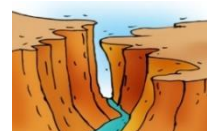
( desert – canyon )