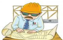
( doctor – architect )