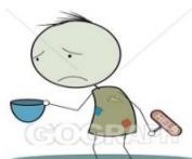
( poverty – wealth )