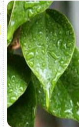
الشكل 1-7 يمثل شكل الورقة ذات القمة الناقصة تكيفاً للبيئة المطرية.

7 - المحافظة على الاتزان الداخلي Maintains homeostasis. يُدعى تنظيم الظروف الداخلية للفرد من أجل الحفاظ على حياته الاتزان الداخلي. وهو ما تشترك فيه جميع المخلوقات الحية. فإذا ما حدث شيء للمخلوق الحي يسبب اضطراباً لحالته الطبيعية، فإن مجموعة من العمليات تبدأ داخله لإعادة اتزانه الداخلي، وإلا فإنه سيموت.