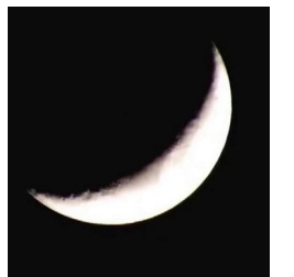
يكون القمر اول الشهر هلال