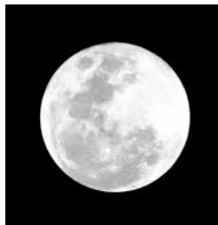
منتصف الشهر بدر