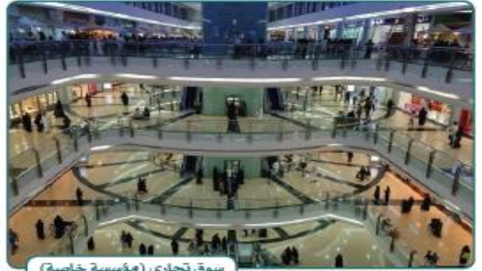
سوق تجاري (مؤسسة خاصة)