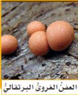
العفن الغروي البرتقالي