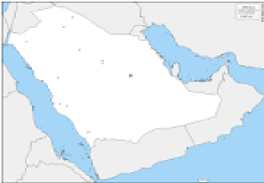
معلمة المادة / حنان الحربي

السؤال الثالث : حددي على خريطة وطني المملكة العربية السعودية مايلي :