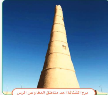
برج الشنائة أحد مناطق الدفاع عن الرس

الإمام عبدالله بن سعود (الدولة السعودية الأولى)