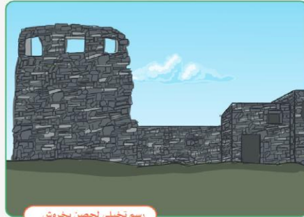
رسم تخيلي لحصن بخروش

طامي بن شعيب وبخروش بن علاس (الدولة السعودية الأولى)