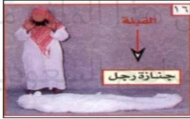
٣- الصلاة عليه