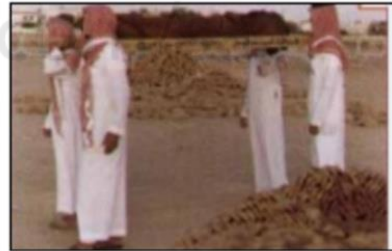
٤- اتباع جنازته

حكمها: فرض كفاية ( إذا قام بها البعض سقط الإثم عن الباقين )