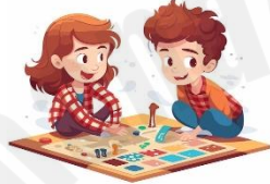
Catch a ball Board game