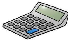
16 – calculator