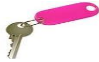
12- Key chain