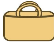
15- tote bag