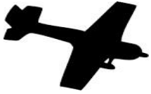
10 – airplane