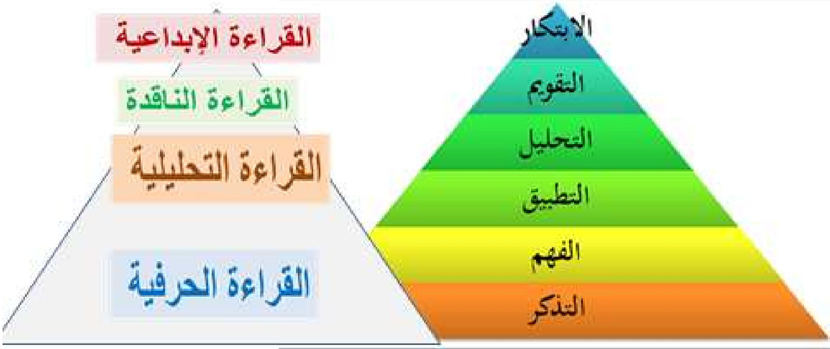
تصنيف المستويات المعرفية (معد علوم)